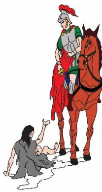
Schutterij Sint Martinus Born