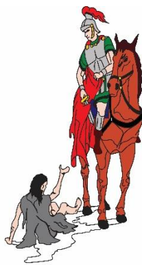
Schutterij Sint Martinus Born