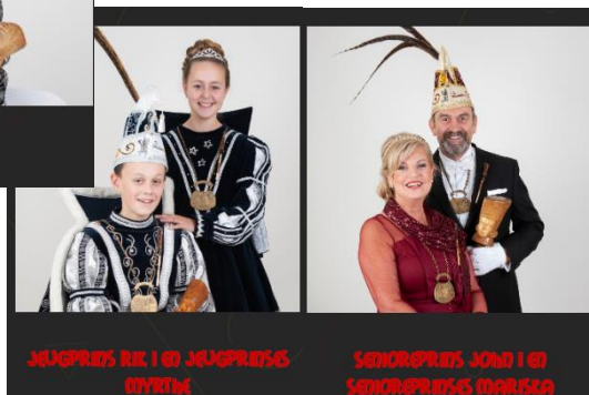
JELGPRINS RIK I en JELGPRINS OYNTJE

koukleumen, dit terwijl het gebruik is dat de schutterij direct naar binnen trekt en als allereerste de receptie opent. Het was verder heel gezellig.