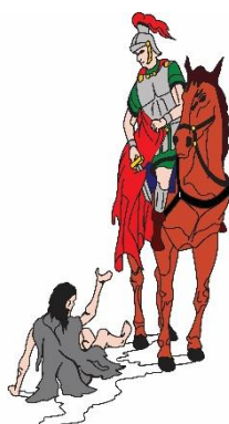
Schutterij Sint Martinus Born